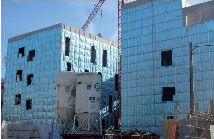
Fachada con TQ TECNOTERMIC A3 situada en la Zona Universitaria de Donostia - San Sebastián.

El producto TQ TECNOTERMIC A3 de TECNOL se ha utilizado para aislar térmicamente la fachada ventilada de la nueva Facultad de Ciencias de la Actividad Física y el Deporte de la Universidad de Donostia - San Sebastián (USS).