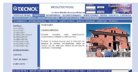
Imágenes de la nueva tienda online de TECNOL.