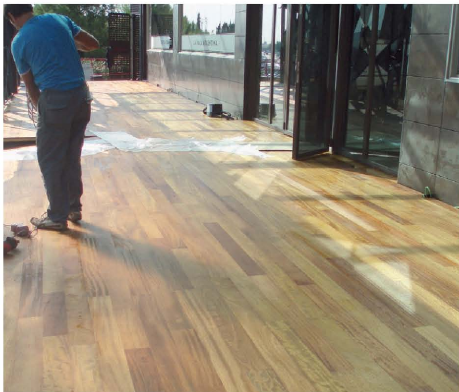
Aspecto tras la aplicación de TQ SOP MARINO.