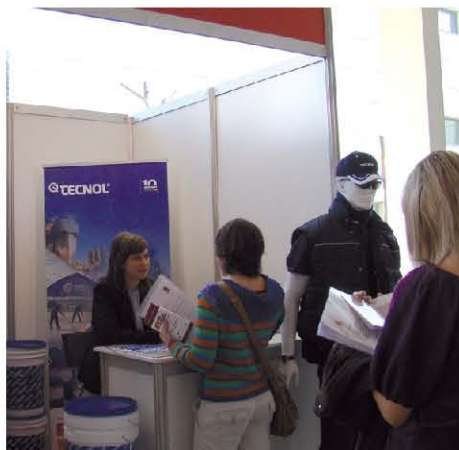
Los jóvenes se interesaron por el proyecto TECNOL.

En total, unos 400 estudiantes visitaron los stands donde se han ubicado 24 empresas como BASF, Applus, Beshotels, Dow Chemical, Port Aventura y TECNOL, entre otras. El Departamento de Recursos Humanos de TECNOL recogió unos 150 currículums de estudiantes y profesionales que buscan nuevas oportunidades de desarrollo laboral. A través de este encuentro, los alumnos de la URV pueden obtener respuestas sobre su futuro laboral, y las empresas pueden comprobar in situ, las motivaciones y expectativas de los jóvenes universitarios.