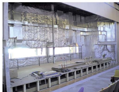
Los apartamentos están a 8 Kilómetros del Aeropuerto Reina Sofía.