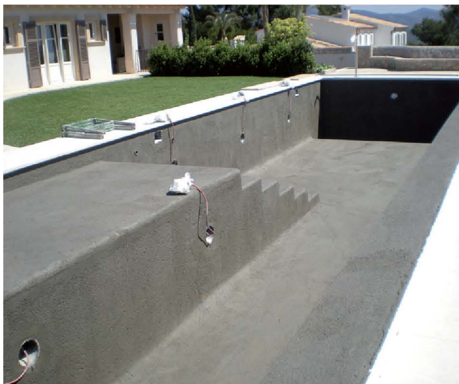
Este mortero es ideal para soportes que pueden sufrir pequeños movimientos.