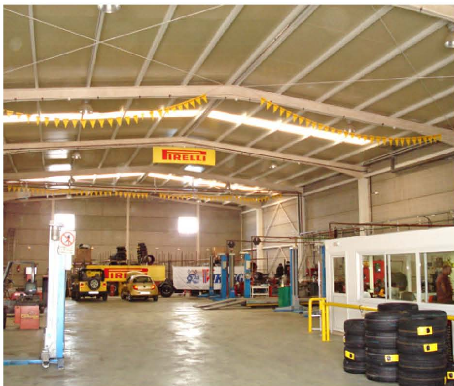
La nave se protegió con una EF de 60 minutos tal y como exige la normativa para este tipo de instalaciones.