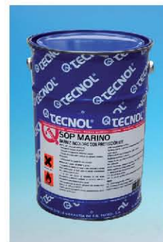
TQ SOP MARINO.

Se utilizó el producto TQ SOP MARINO ya que es muy resistente y el suelo soporta un elevado tránsito de personas. Primero se preparó el soporte y luego se aplicaron 3 manos de TQ SOP MARINO.