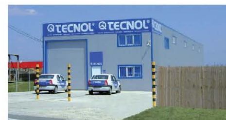
Delegación TECNOL en Rumanía.