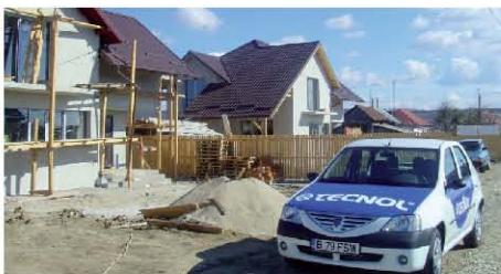
TECNOL se está consolidando como empresa de asesoramiento técnico.