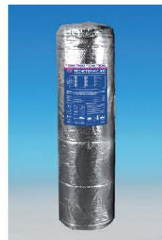
TQ TECNOTERMIC A10.

El aislamiento se llevó a cabo con TQ TECNOTERMIC A10 para disminuir la transmisión del ruido aéreo y mejorar el confort térmico, cumpliendo con las exigencias del Código Técnico.