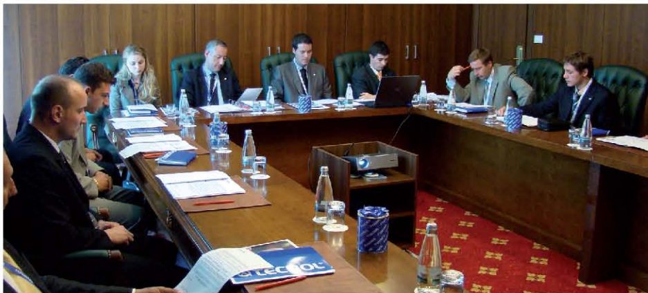
La Convención de Ventas se celebró el 9 de mayo en el Hotel Ramada de Brasov.

Los proyectos se presentaron a principios de mayo durante la primera Convención de Ventas celebrada en Rumanía.