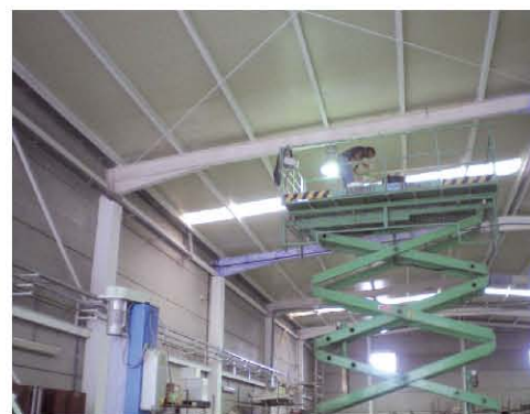
La aplicación se realizó con liana para no interrumpir la actividad del taller.