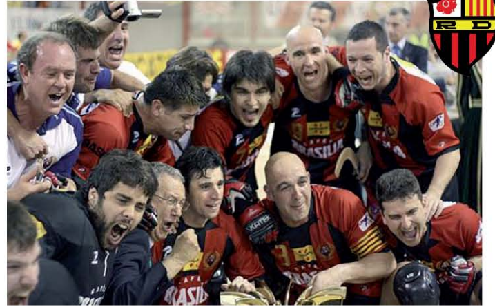
El equipo celebra el Campeonato del Mundo de Clubes.

Para llevar a cabo esta aplicación, se han utilizado un total de 3.000 m 2 de TQ TECNOTERMIC A3. La sujeción de este aislante se realizó empleando las omegas de soporte de la fachada ventilada y se utilizó también TQ CINTALUMINIO para hacer los solapes.