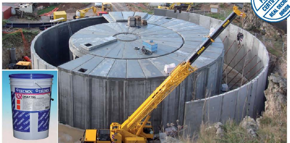
TQ DRAYTEC puede utilizarse en depósitos de agua potable.

La composición de estos productos tiene como objetivo adecuarse al actual Real Decreto 866/08 sobre materiales destinados a entrar en contacto con alimentos. Estos productos además, superan las exigencias marcadas en la circular DGS/VS4/nº99/217 para materiales en contacto con aguas de consumo humano y que han sido objeto de estudio en dichos ensayos.