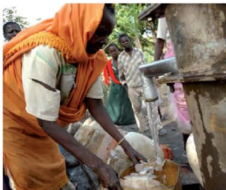
Sólo el 2% de la población tiene acceso al agua.

En la misma línea, y para evitar enfermedades y el elevado número de mortalidad, se están llevando a cabo trabajos relacionados con el agua y su saneamiento, como por ejemplo, vallar y limpiar las fuentes de agua, preparar material para la construcción de más pozos, organizar comités de higiene y distribuir utensilios de primera necesidad para cocinar.