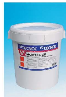
TQ MORTEC EF.

Para obtener una Estabilidad al Fuego de 60 minutos (EF-60), se dió una primera mano con TQ COLAFIX GRIP y a continuación se aplicó TQ MORTEC EF con liana hasta alcanzar los 5 mm de espesor.