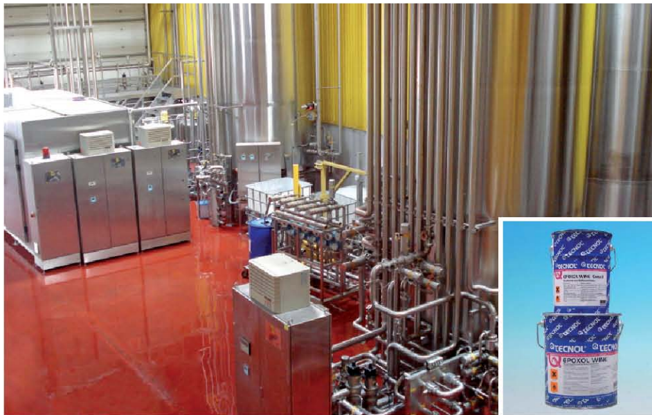
TQ EPOXOL WINE se utiliza en tanques de contención de aceite, vino y agua.

TECNOL ha presentado unos ensayos de resistencia química a 20°C, 50°C y 70°C del producto TQ EPOXOL WINE. Las pruebas, realizadas en el laboratorio interno de la compañía bajo unas condiciones determinadas, son una guía para que el técnico pueda evaluar la idoneidad del producto TQ EPOXOL WINE .