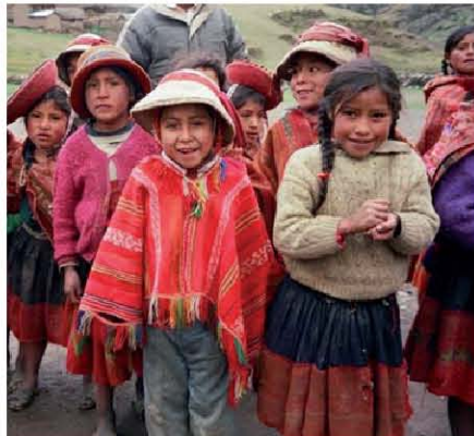
Las tasas de asistencia escolar en Perú son del 80,6%.

Con este proyecto, que beneficiará a 148 alumnos y sus familias de dos CRFA de las localidades de Quispamarca y Miraflores, en la región de Apurímac, se mejorará la estructura de los centros, se construirá un dormitorio y una aula y se adquirirá el equipamiento necesario para estos espacios.