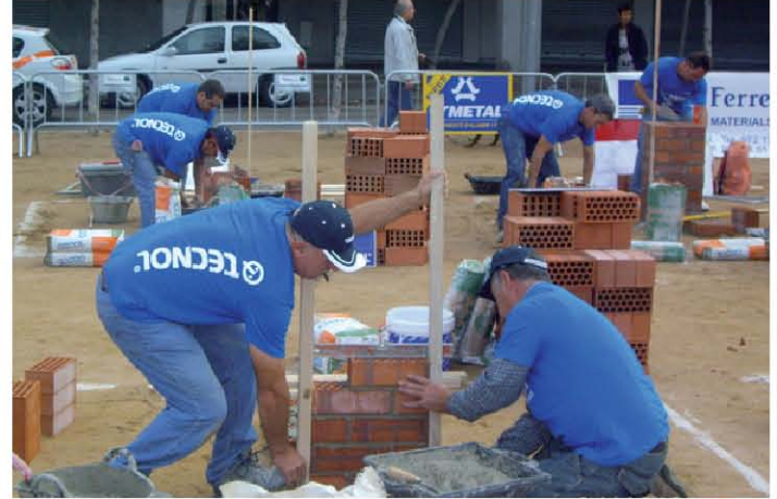
Las parejas están formadas por un albañil y un peón.

Como cada año, TECNOL colabora con los eventos relacionados con el mundo de la construcción y sus profesionales. Un ejemplo, son los Concursos de Albañiles que se celebran periódicamente en varias ciudades españolas y que cuentan con la participación de pequeñas empresas constructoras.