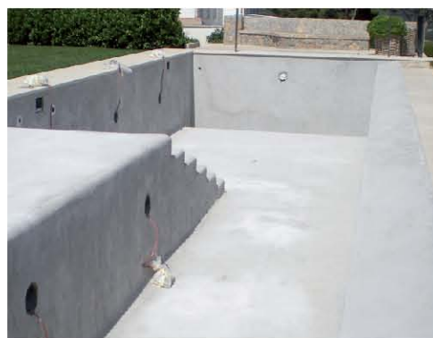
Este producto puede aplicarse con brocha, rodillo y liana.