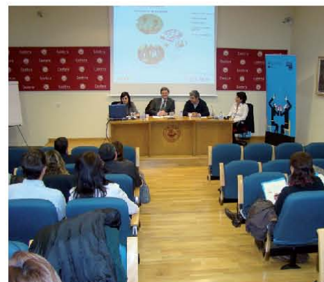
En total, más de 400 personas asistieron a las ponencias sobre igualdad.

TECNOL fue invitada como ejemplo de implantación del Plan de Igualdad, y como modelo de política social. También participaron Algües de Barcelona y Contratas y Obras Empresa Constructora.