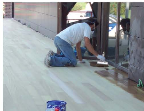
Tarima del restaurante antes de la aplicación.