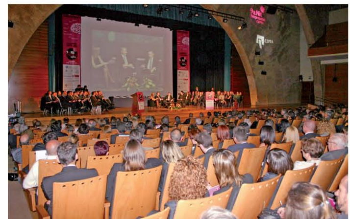
Más de 1.000 empresarios asistieron al acto celebrado en Tarragona.