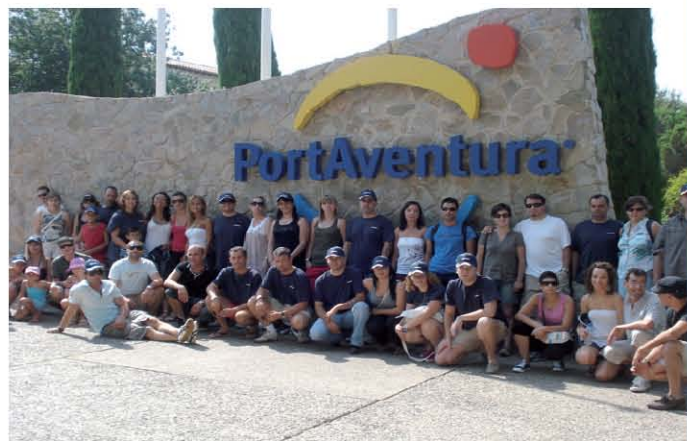
En total, más de 200 personas han participado en el evento.

Para recompensar el trabajo y para ratificar los buenos resultados obtenidos durante el primer semestre del año, los dos últimos fines de semana de junio y durante todos los fines de semana de julio, TECNOL ha celebrado con sus empleados y familiares, los Weekend's Championship, con el objetivo de fomentar la cohesión, el compañerismo y el trabajo en equipo.