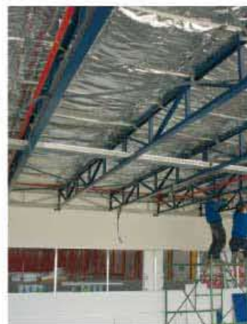
Aplicación de TQ TECNOTERMIC A6-C13 en falso techo.

TECNOL ha desarrollado el nuevo producto TQ TECNOTERMIC A6-C13 , un aislante térmico reflexivo multifecto de 13 elementos . Este producto reduce los costes globales durante la aplicación ya que mejora el precio sobre otros aislantes reflexivos y sobre los otros productos aislantes convencionales. Sus componentes reflejan la radiación térmica, reducen la transmisión por conducción y disminuyen las aportaciones de calor transmitido por convección.