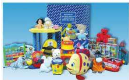
En total, se recogieron un centenar de juguetes y peluches para los niños.

Con este acto, TECNOL pretende reafirmar su compromiso con la responsabilidad social y la sociedad que la envuelve como viene haciendo habitualmente con varias ONG's.