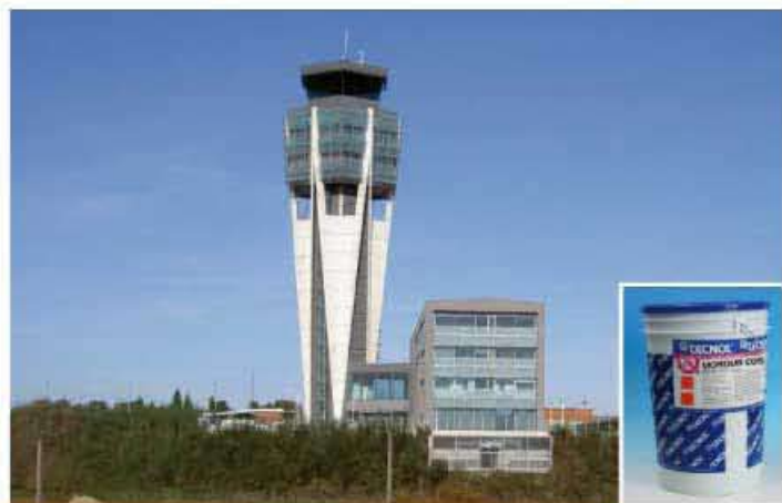
Una vez finalizadas las obras, el aeropuerto dispondrá de 12 puertas de embarque y 32 mostradores de facturación.

El producto TQ MORDUR COSMETIC se ha utilizado para la mejora de las coqueas e imperfecciones del hormigón de los muros y pilares durante la remodelación del Aeropuerto de Lavacolla , a unos 10 Kilómetros de Santiago de Compostela. TQ MODUR COSMETIC es ideal para la reparación y la nivelación de superficies dañadas de hormigón en estructuras, pilares, fachadas, cornisas, etc.