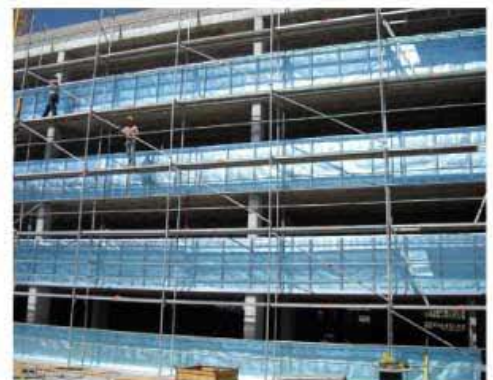
Al presentarse en rollos, la aplicación es fácil y limpia.