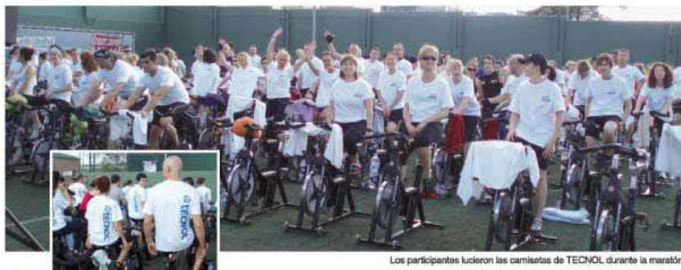
Los participantes lucieron las camisetas de TECNOL durante la maratón.

En total, 150 personas , pedalearon durante 3 horas , después de pagar una inscripción simbólica destinada íntegramente a la ONG Fundación María Castro Cruz de Valencia. En ediciones anteriores, los fondos recaudados en este acto se destinaron a otras ONG's como Médicos Sin Fronteras.