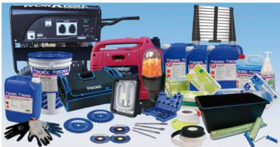
TECNOL ha apostado en 2009 por la inversión en investigación y desarrollo de productos para hacer frente a la coyuntura económica actual del mercado.

Este año, como viene siendo habitual, también se han lanzado al mercado nuevas máquinas WorkWay Tools, la marca de herramientas eléctricas de alta calidad distribuidas en exclusiva por TECNOL, así como productos para el tratamiento de agua de piscinas como TQ INVERNOL , TQ ALGATEC o TQ CLOR FLUID .