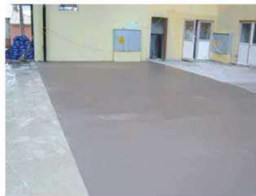
Primero se aplicó TQ UNIFIX porque el soporte era muy poroso.