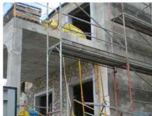
TQ I-TERMIC está formado por microburbujas de vidrio huecas.