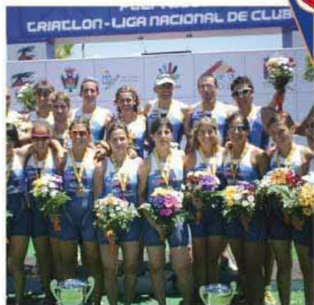
Representantes del Reus Ploms, el mejor equipo español de triatlón.

Desde el año 2006 TECNOL colabora con la sección de triatlón del Reus Ploms creada en el 1990 y que en la temporada 2008 ocupaba la primera posición en el Ránking Nacional de Clubes de España .