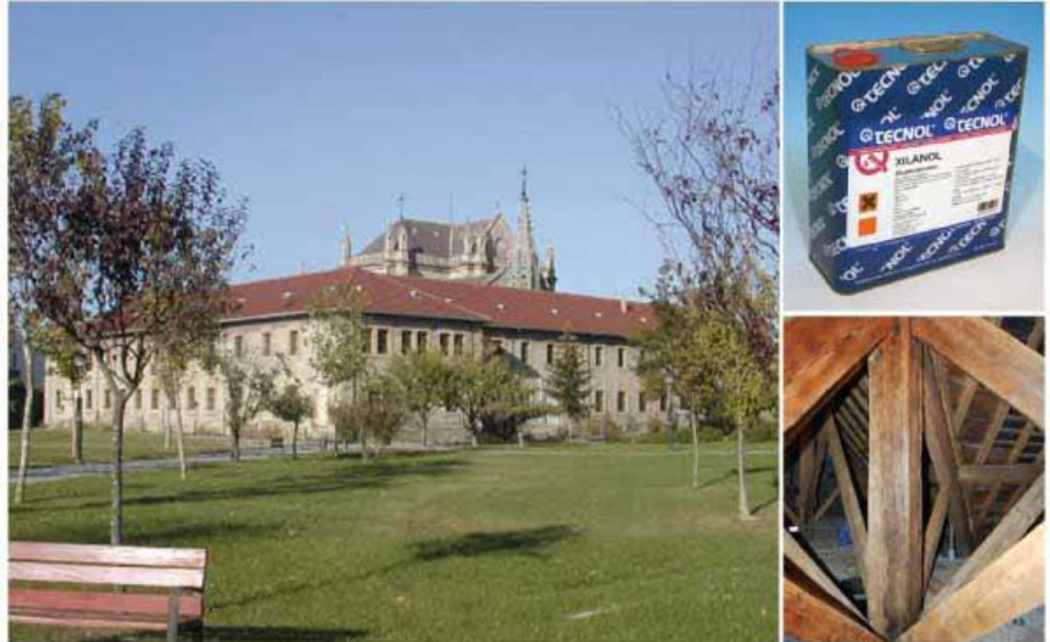
Convento de Betoño, situado en la ciudad vasca de Vitoria, y detalle de las vigas de madera que se trataron con el producto TQ XILANOL.

Para ello, en el proceso de protección de la madera se aplicó TQ XILANOL como protector anticarcoma. TQ XILANOL es un barniz a base de resinas acrílicas que embellece la madera, penetrando en el interior realizando de esta forma, el veteado de la misma .