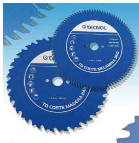
Los discos de madera desarrollados por TECNOL ofrecen un corta profesional.

Los dos discos son aptos para corte de tableros de aglomerado, fibra endurecida, placas de cartón yeso, etc. e incorporan orificios auxiliares para estabilizar el disco durante su arranque y uso.