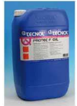
TQ PROTEC F OIL.

Se aplicó TQ DESCANET sobre el soporte para eliminar la suciedad. A continuación la fachada se hidrofugó con TQ PROTEC F OIL para evitar problemas de humedades, eflorescencias y aparición de salitre.