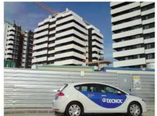
TQ PROTEC F OIL es un hidrófugo hidrorrepelente de base disolvente.