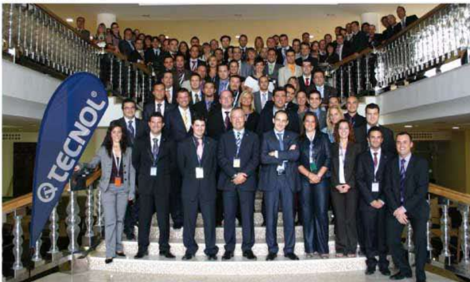
Empleados de TECNOL durante el Seminario de Ventas celebrado en el Hotel Gran Palas Convencions & Spa Wellness de La Pineda (Tarragona).

Con presencia en España, el Principado de Andorra, Francia y Rumanía, TECNOL ha dedicado sus esfuerzos internacionales a la consolidación de la red comercial y la expansión a nuevas regiones, como es el caso de Rumanía. Actualmente, la dirección de TECNOL está diseñando un plan de expansión para Portugal, dónde la compañía tiene previsto establecerse mediante una estrategia de mancha de aceite para penetrar en este mercado lentamente.