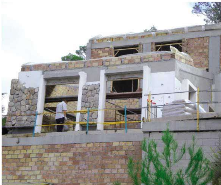
El aspecto rugoso de TQ I-TERMIC permite aplicar encima el acabado deseado, en este caso, la aplicación se terminó con revestimiento de piedra natural.