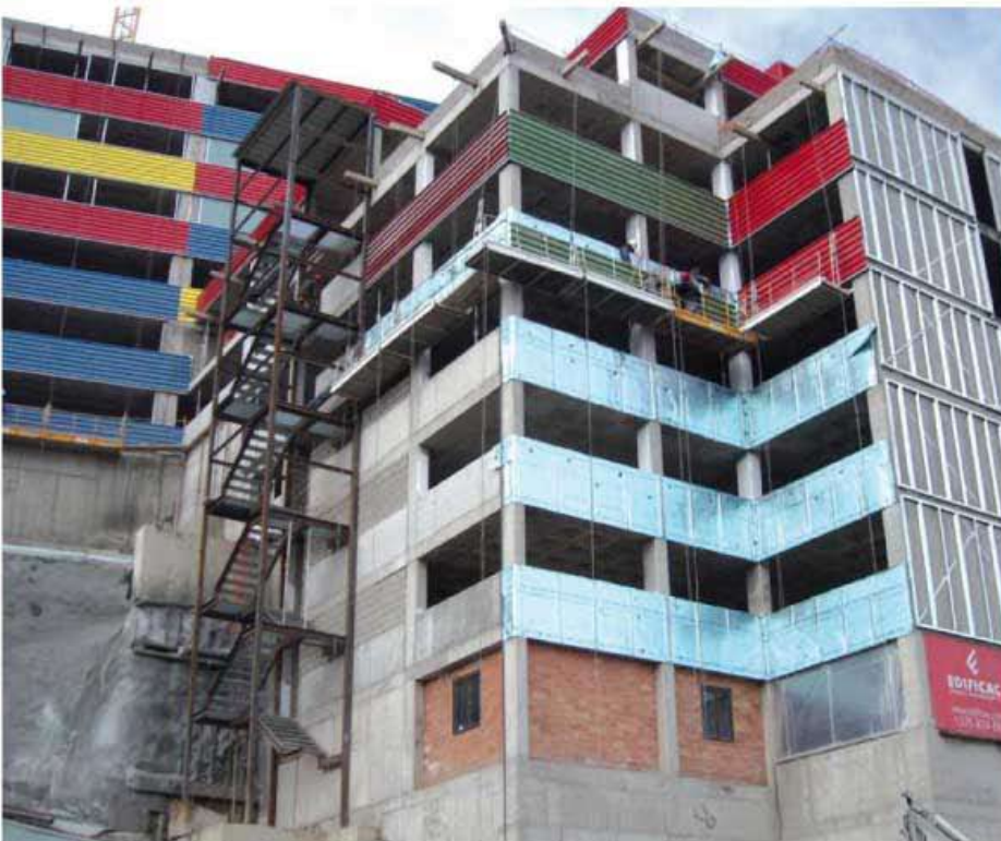
La aplicación garantiza un excelente aislamiento térmico en todas las plantas del parking, situado en una zona expuesta a bajas temperaturas.