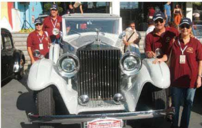
Entre los coches que participaron en la concentración había SEAT 600, FIAT 500 y Ford Mustang.

El 24 de septiembre tuvo lugar en Torremolinos (Málaga) , la XIV Concentración Amigos de los Clásicos que se celebró durante la FERIA de San Miguel y que fue organizada por el club Amigos de los Clásicos.