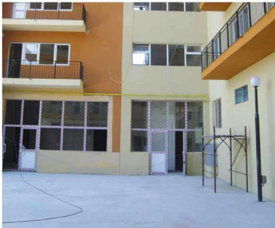
TQ MORSUL, mortero seco a base de cemento, resina, aditivos especiales y áridos seleccionados, se aplicó en todos los pavimentos.