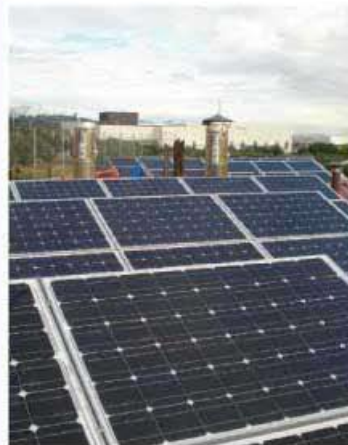
El Pacto Mundial reúne a empresas que respetan el medio ambiente y utilizan recursos y tecnologías renovables.