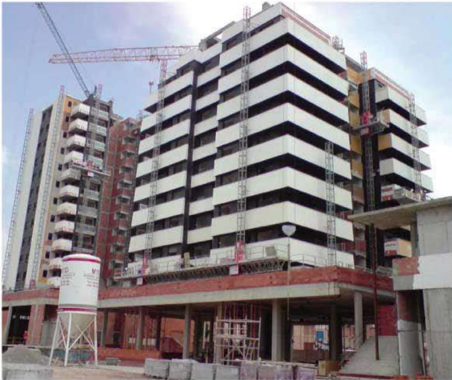
TQ DESCANET se combinó con TQ PROTEC F OIL para conseguir un acabado perfecto de esta fachada en Molina de Segura (Murcia).