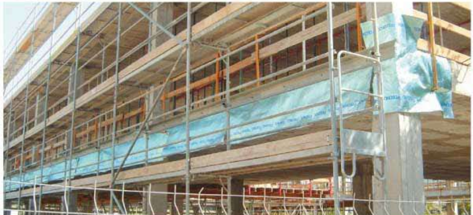
La composición de TQ TECNOTERMIC reduce los costes de instalación, calefacción y refrigeración, contribuyendo al desarrollo sostenible.

El producto TQ TECNOTERMIC se ha utilizado para aislar térmicamente el nuevo Centro de Atención Primaria (CAP) de Molins de Rei (Barcelona) de 2.467 m 2 . El cliente Seis, del Grupo ACS ha sido el encargado de construir el primer edificio de Cataluña que funcionará con biomasa ( energía verde ) que tiene como objetivo optimizar la energía.