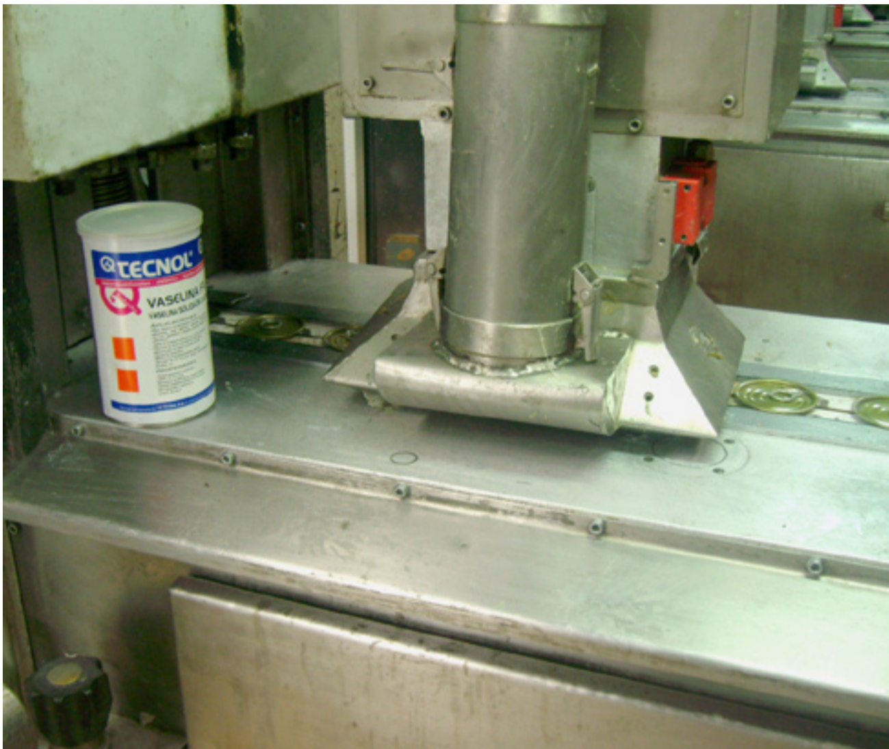
El producto TQ VASELINA FILANTE es de calidad alimenticia y medicinal, además de ser neutra y anticorrosiva, ideal para industria alimentaria.