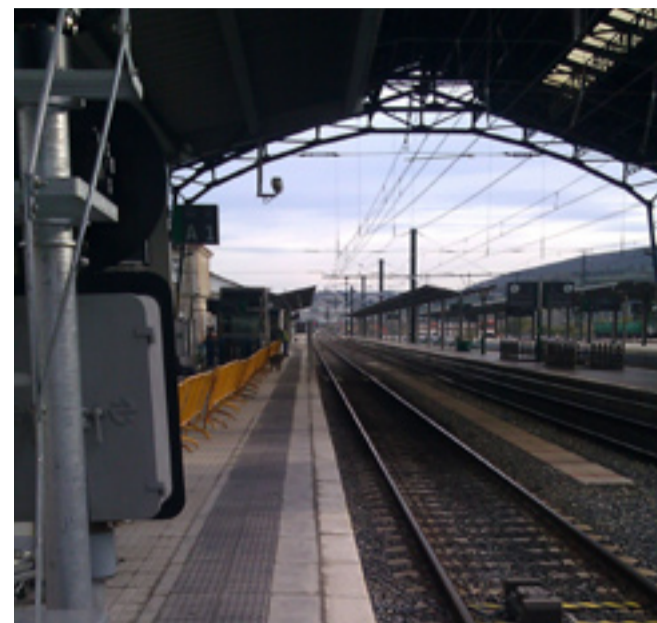
La estación del AVE de Santiago tiene más de 25.000 metros cuadrados.

La combinación de estos dos productos da como resultado un acabado antideslizante imprescindible para la seguridad en estaciones de trenes, escaleras, rampas, suelos resbaladizos, etc.