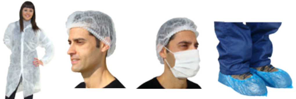
Batas - Gorros - Mascarillas - Cubre zapatos - Cubre mangas