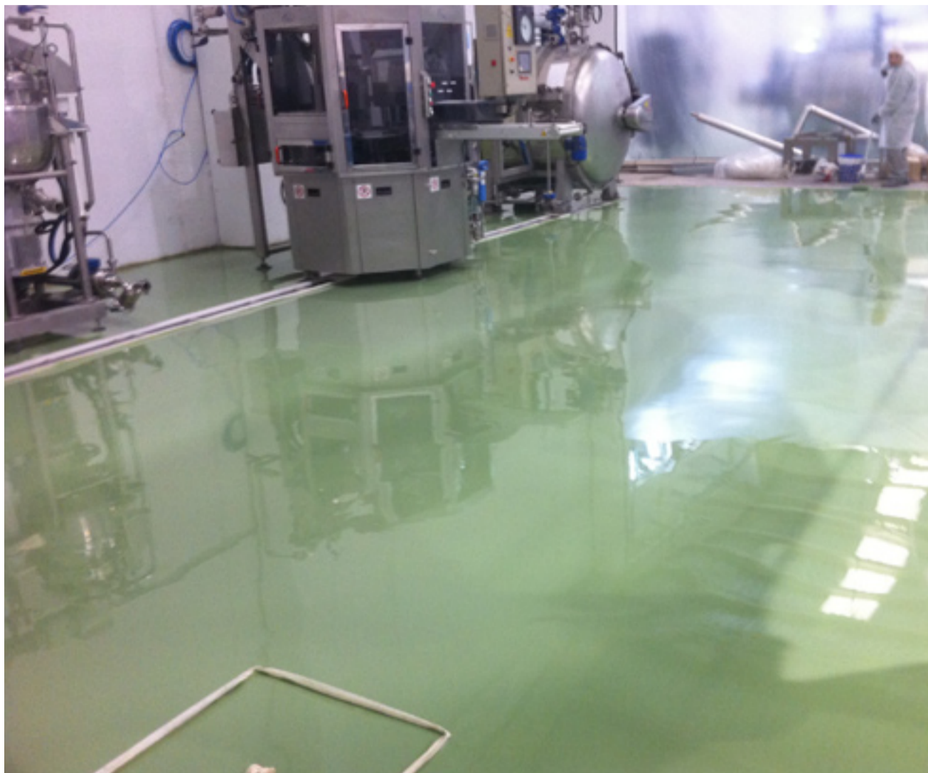
Verdifresh es una empresa que fabrica productos de IV gama (vegetales mínimamente procesados en fresco), con Mercadona como único cliente.