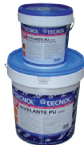
TQ NIVELANTE PU.

La aplicación se realizó a través de la empresa colaboradora Atyco, de Castellón, que aplicó primero una capa TQ EPOXOL W INCOLORO ya que el suelo no era poroso. Después, se realizó una capa con TQ NIVELANTE PU , en verde.