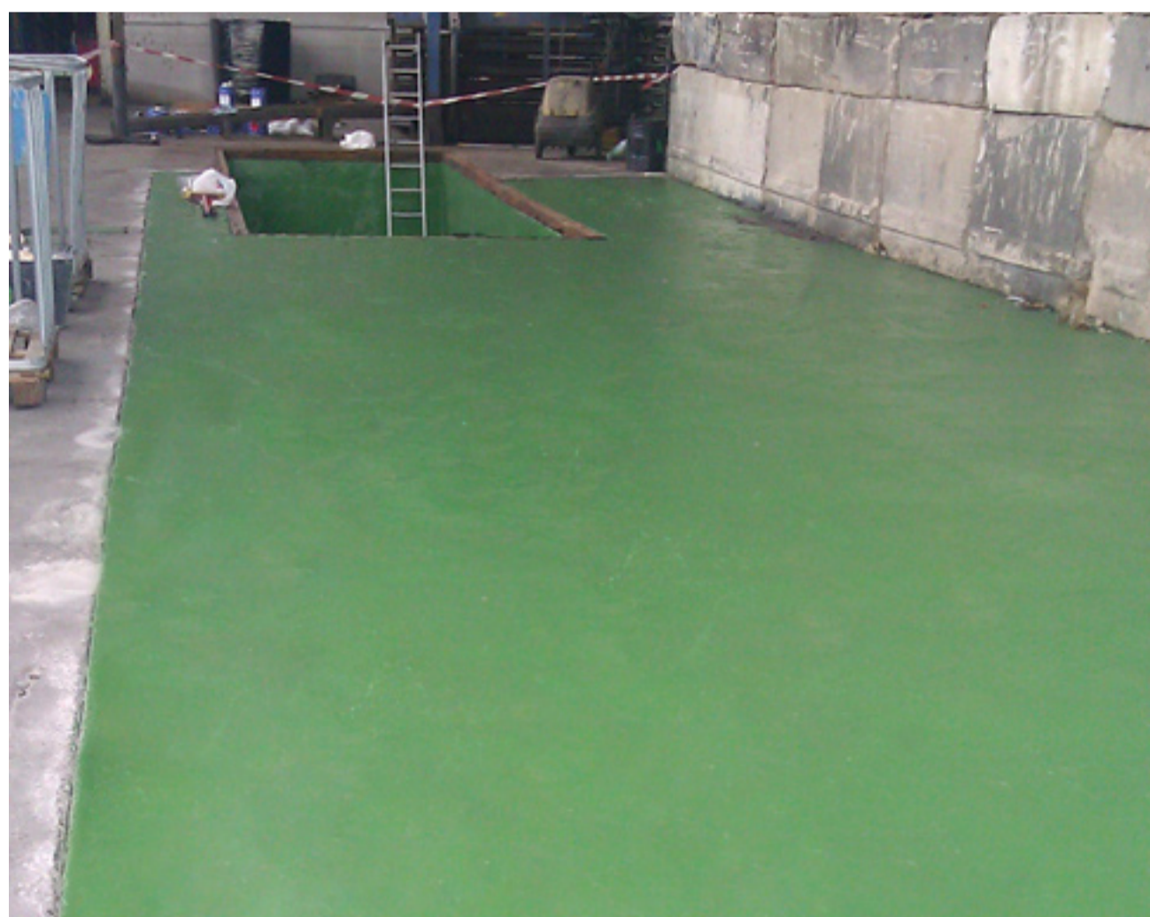
Para un resultado óptimo, se limpió la superficie con TQ DESCANET DS y se repararon las zonas dañadas del hormigón con TQ MORDUR QUICK.