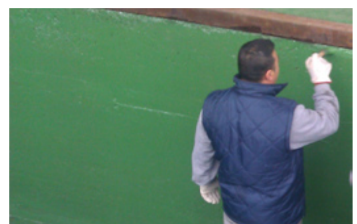
TQ EPOXOL es una pintura a base de resina epoxi de altas prestaciones.