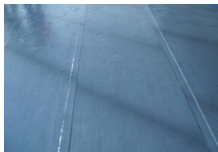
Detalle de TQ LAMITEC, que cumple con el marcado CE de la EN 13707.