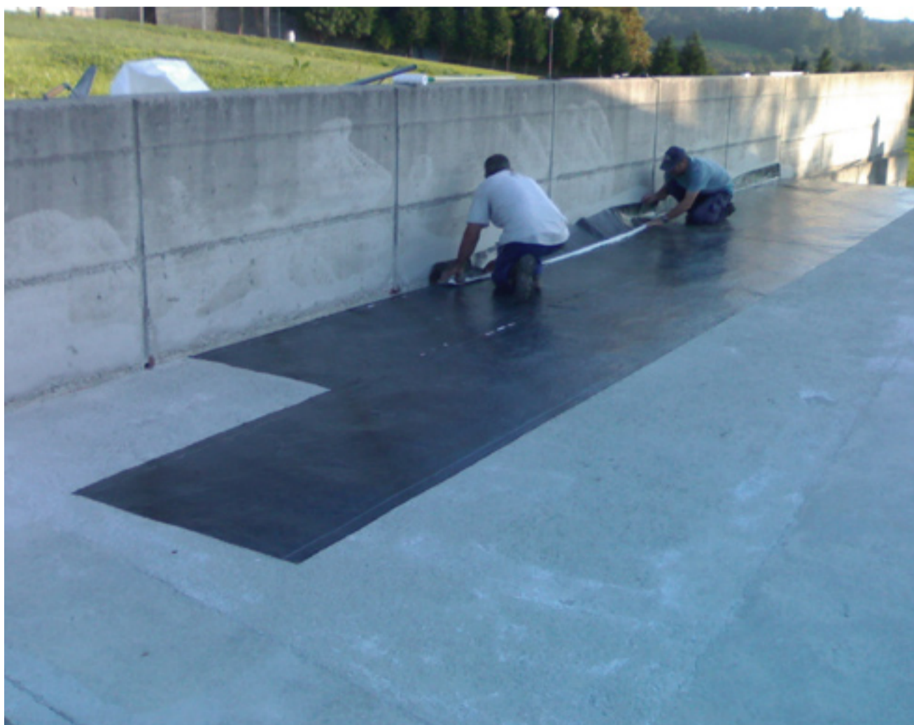
TQ LAMITEC es una membrana impermeabilizante autoadhesiva que al ser flexible, permite movimientos de contracción, dilatación y asentamiento.