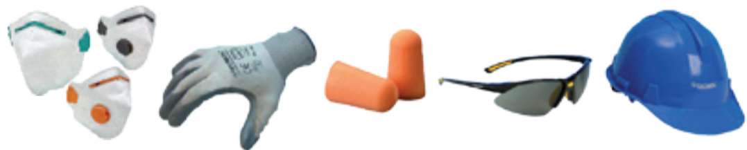
Mascarillas - Guantes - Protección auditiva - Gafas - Cascos