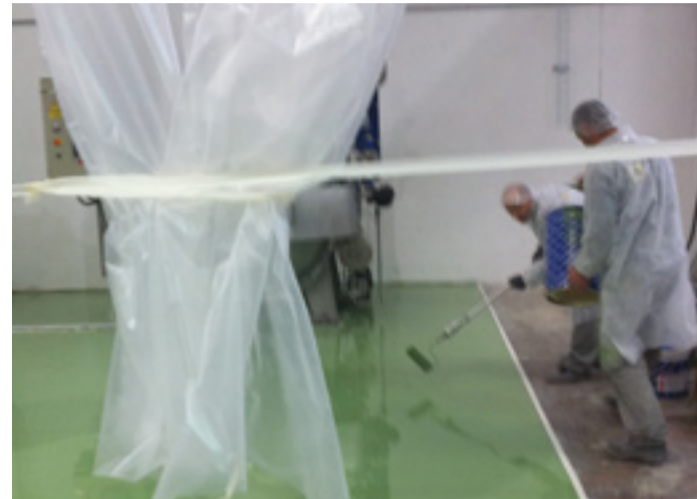
La aplicación se llevó a cabo en las instalaciones de la Comunidad Valenciana.