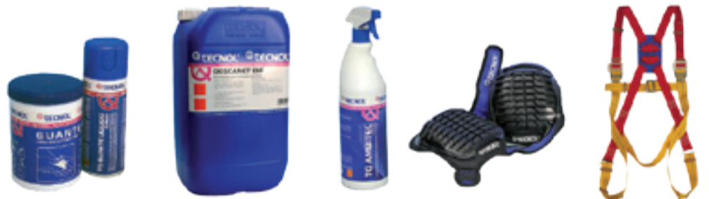
Limpiadores - Desengrasantes - Ambientadores - Protección