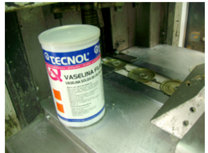
El producto se usa en automoción, trabajos agrícolas y todo tipo de industrias.