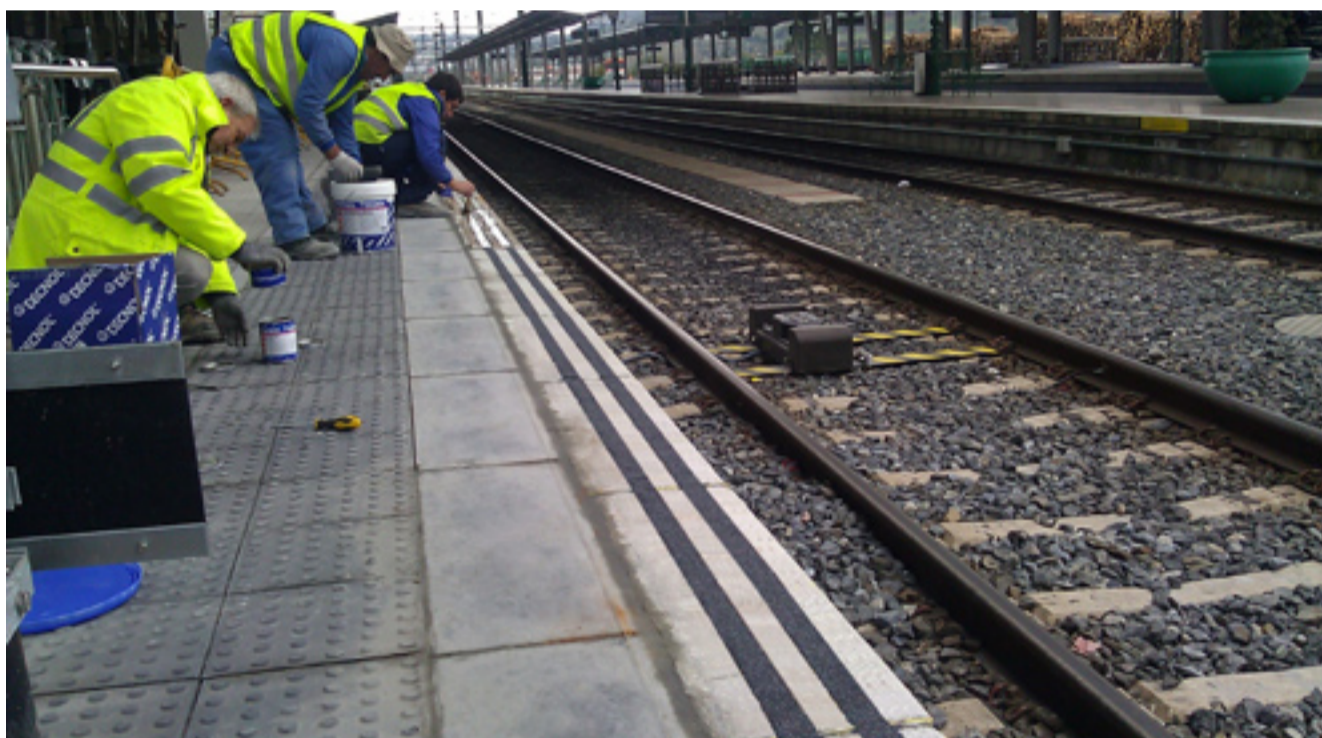
Resultado final de la aplicación al borde del andén de la estación del AVE con las partículas de carburo de silicio, TQ CARBORUNDO.