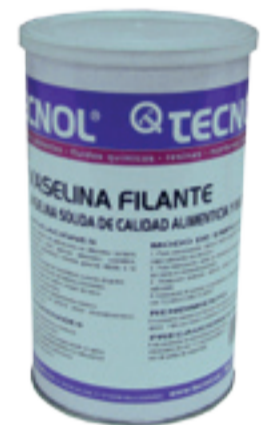
TQ VASELINA FILANTE.

Para un mejor funcionamiento de las máquinas, se aplica un barniz protector y TQ VASELINA FILANTE, que impide que el barniz se endurezca y que la limpieza sea mucho más rápida. Este producto es neutro y anticorrosivo, y es ideal para la industria alimentaria.